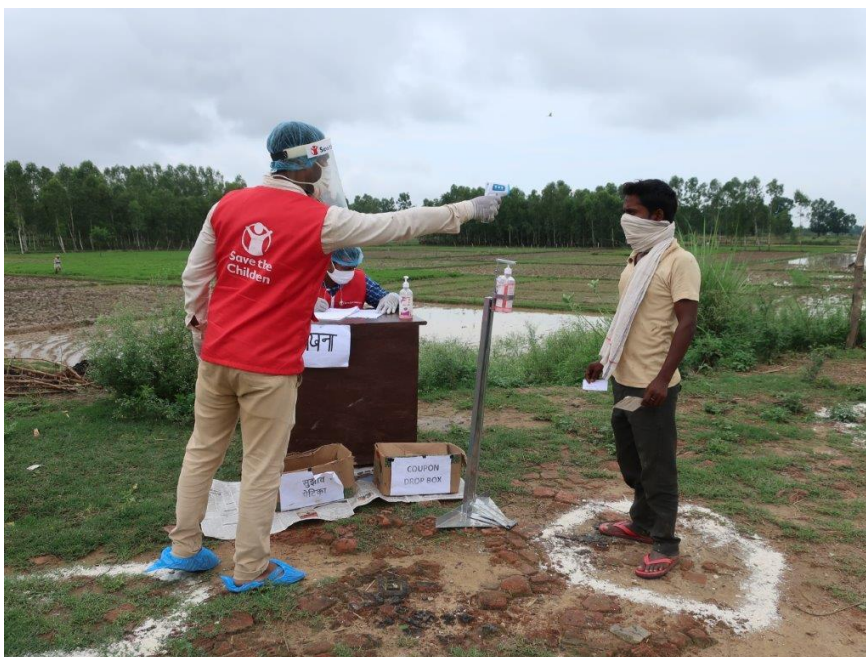
Zur Pandemiebekämpfung in Indien hat Save the Children ein Sofort-Nothilfeprogramm aufgelegt (Foto Credits: Save the Children).