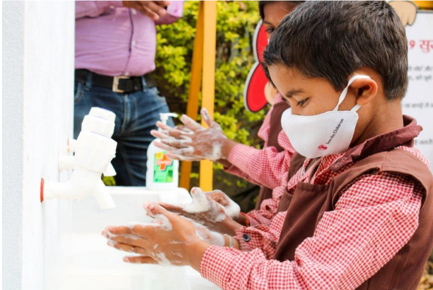
Save the Children hilft in Kooperation mit lokalen Organisationen vor Ort in Indien.